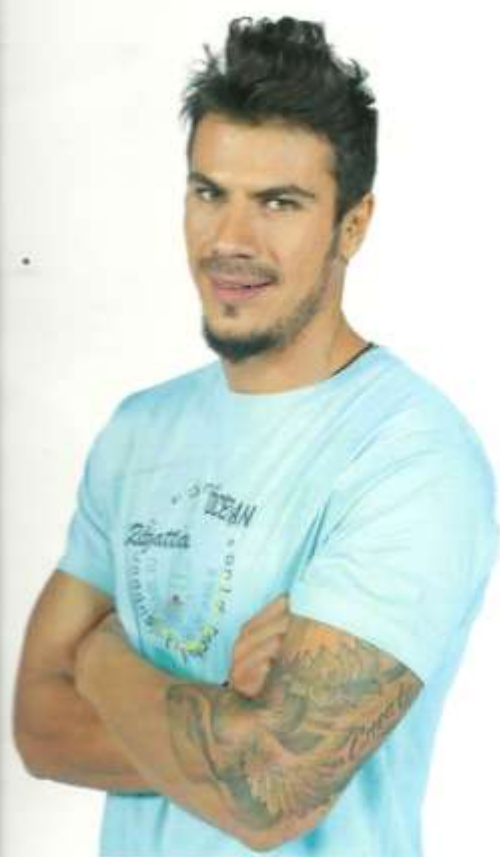
1ο Έλληνα Master Chef