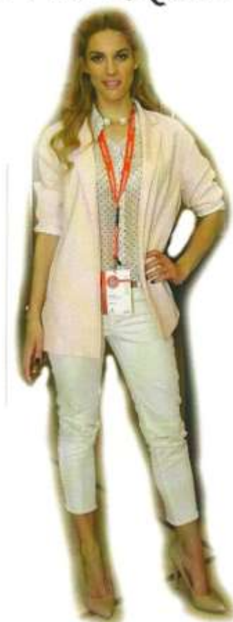
Γνωστή "Αμαζόνα" διαφήμιση